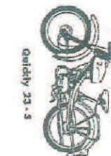
Quickly 23 - S