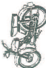
Quickly 23 - F