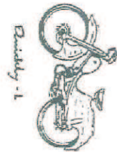
Quickly - L