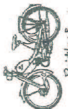
Quickly - S