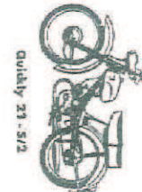
Quickly 23 - S/2

NSU - Quickly - Treff NSU Zweiräder Teilemarkt