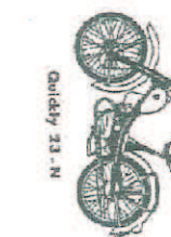
Quickly 23 - N

Für das leibliche Wohl ist wie immer bestens gesorgt!