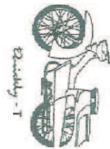
Quickly - T