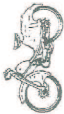
Quickly - L