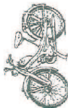
Quickly - N