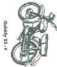
Quickly 23 - F